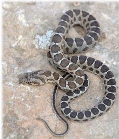
וזעמן מטבעות, דומים אך שונים!

למתעניינים או לאלו המנסים להתגבר על פחדים מזוחלים ורמשים אמליץ להתחבר לקבוצת הפייסבוק לצילום חרקים, זוחלים ועוד. בקבוצה זו ישנם הרבה מומחים, חובבים וסקרנים המעלים תמונות, בקבוצה זו תוכלו לקבל זיהוי וכמו כן הרבה מידע https://www.facebook.com/groups/bugsphoto