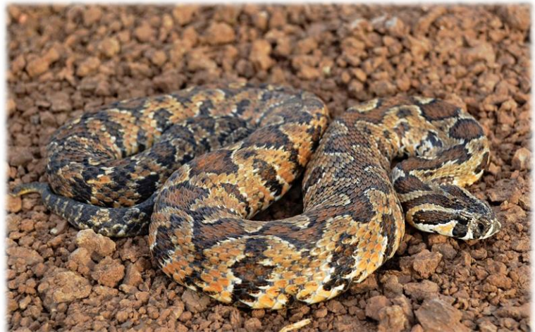
צפע ארץ ישראלי